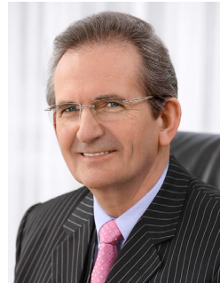
Hermann Dinkla – Präsident des Niedersächsischen Landtages

am 20. Januar 2013 wählen die Bürgerinnen und Bürger den Niedersächsischen Landtag der 17. Wahlperiode. Die anstehende Wahl ist ein höchst geeigneter Anlass, um den jungen Menschen unseres Landes das Thema „Wahlen“ und deren Bedeutung für eine freiheitliche Demokratie und einen dauerhaft stabilen Rechtsstaat nahezubringen.